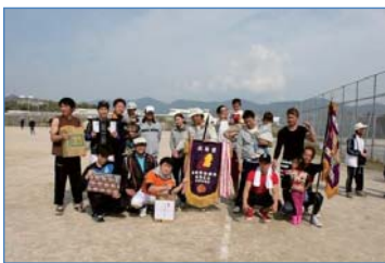
☆ 優勝 廿日市地区